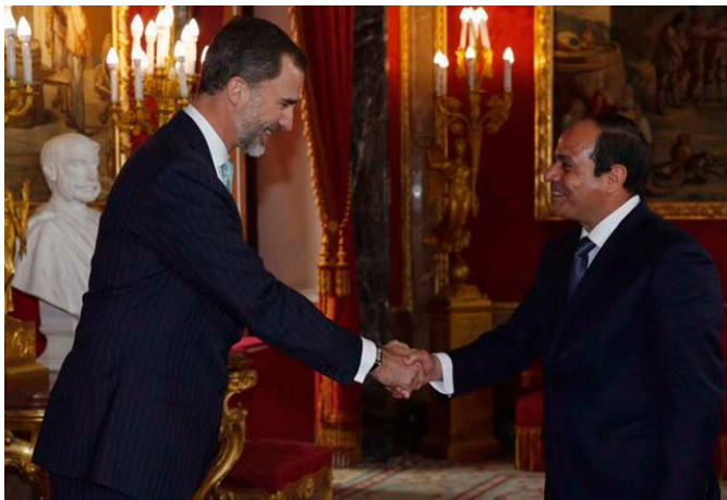
El rey Felipe VI y el presidente de Egipto, Abdel Fattah el Sisi, durante su visita oficial a España, pasean por los jardines del Palacio de la Zarzuela, en abril de 2015.