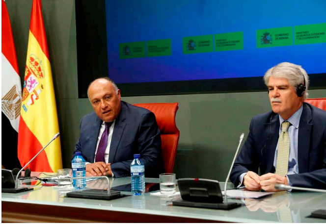
El ministro egipcio de Asuntos Exteriores, D. Sameh Shoukry con el ministro de Asuntos Exteriores de España, D. Alfonso Dastis. Madrid, 15 de febrero de 2018

Industria, Energía y Turismo del Reino de España y el Ministerio de Turismo de la República Árabe de Egipto.