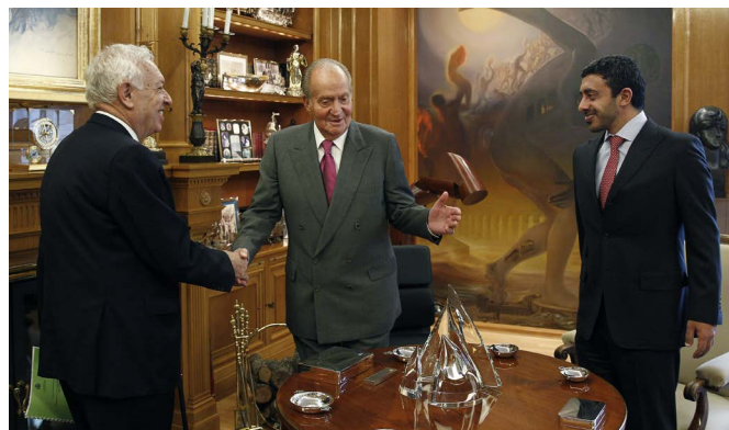
S.M. el rey Juan Carlos, Junto al ministro de Asuntos Exteriores y de Cooperación y su homólogo emiratí, Abdullah bin Zayed Al Nahyan, durante la audiencia celebrada en el Palacio de La Zarzuela en febrero de 2014.

Ministro de Estado para Asuntos de Educación General: H.E. Jameela bint Sa-