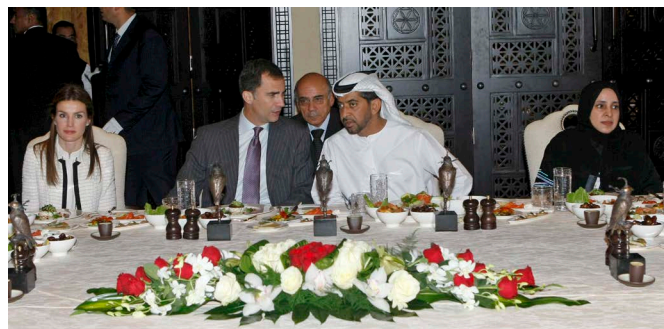
SS.AA.RR. los Príncipes de Asturias, junto al Jeque Hamdan Ben Zayed Al-Nahyane, vicepresidente del Consejo de Ministros de los Emiratos Árabes Unidos, y la Embajadora de los Emiratos Árabes en España, Hissa Al Otaiba, durante su visita a Emiratos Árabes Unidos en enero de 2010.