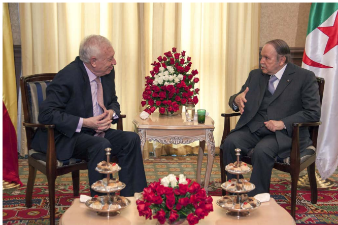
El presidente argelino, Abdelaziz Buteflika, junto al entonces Ministro de Asuntos Exteriores y de Cooperación, José Manuel García-Margallo, en la residencia de Estado de Zerralda, en Argel. 12/04/2014.

Económico de África (BADESA), del Fondo Árabe para el Desarrollo Económico y Social (FADES), y del Banco Islámico de Desarrollo.