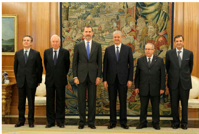
Audiencia de SM el Rey al Primer Ministro Sellaal con ocasión de la celebración de la VI RAN en Madrid, el 21 de julio de 2015.

En lo que respecta a las relaciones con Marruecos, los contenciosos tradicionales persisten y las fronteras terrestres entre Marruecos y Argelia permanecen cerradas.