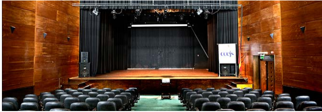
Imagen del Auditorio 'Manuel de Falla' del Centro Cultural de España en Asunción 'Juan de Salazar'