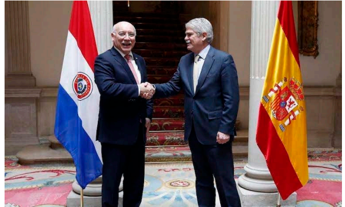
Alfonso Dastis, ministro de Asuntos Exteriores y Cooperación saluda a Eladio Loizaga, ministro de Relaciones Exteriores de Paraguay con motivo de su visita a Madrid.- Julio 2017.-