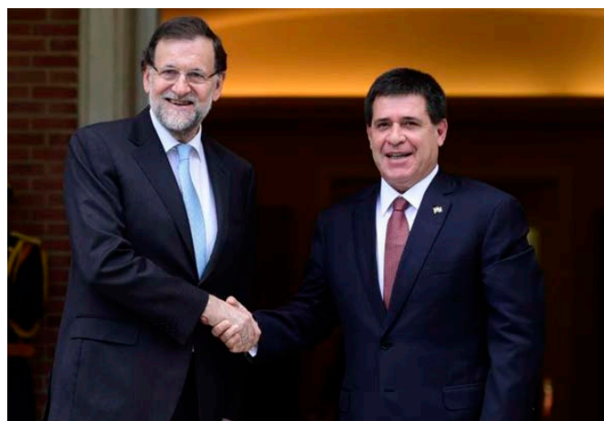
El presidente del Gobierno, Mariano Rajoy, saluda al presidente de Paraguay, Horacio Cartes, durante su visita a Madrid en junio de 2015.