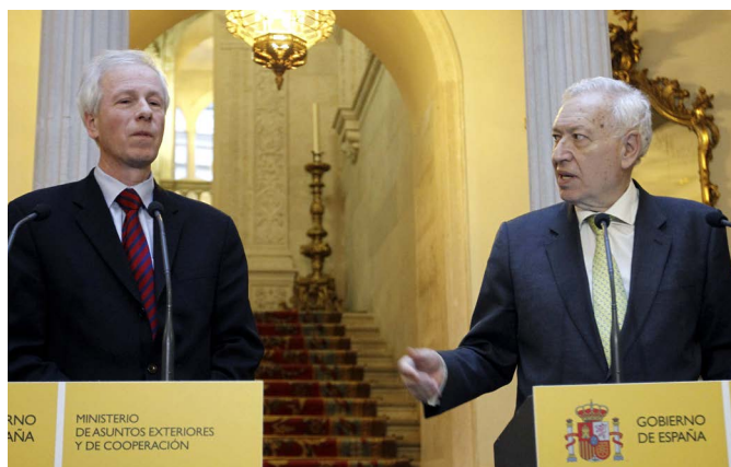
El entonces ministro de Asuntos Exteriores de Canadá, Stéphane Dion, junto al anterior Ministro de Asuntos Exteriores y de Cooperación, José Manuel García-Margallo, durante su visita a Madrid en marzo de 2014