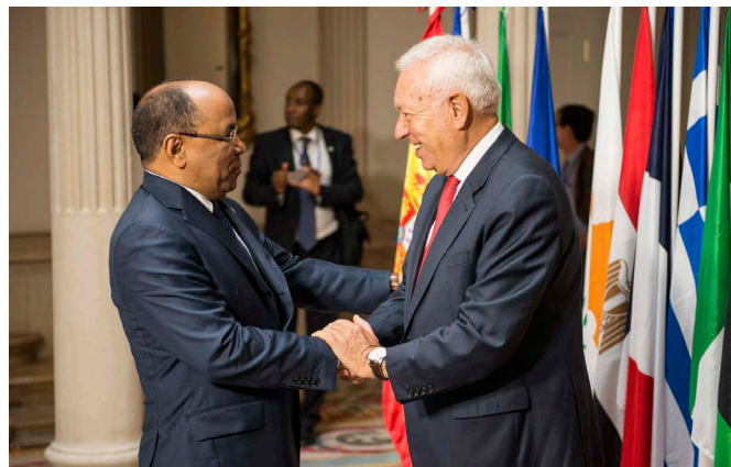
El ministro de Asuntos Exteriores y de Cooperación, José Manuel García-Margallo, saluda a su anterior homólogo mauritano, Ahmed Ould Teguedi, durante su visita a Madrid con motivo de la Conferencia de Libia, en septiembre de 2014.

En el marco del sector de la Seguridad Alimentaria cabe destacar el proyecto AECID de mejora del acceso al consumo de pescado de la población mauritana,