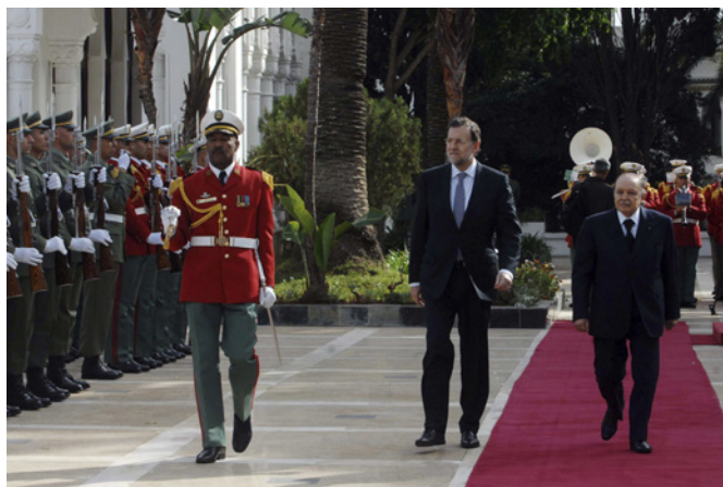
El presidente del Gobierno, Mariano Rajoy, junto al presidente de Argelia, Abdelkader Bouteflika, durante su visita a Argel en enero de 2013.

Desde 1965 es miembro de la Unión de Escritores Argelinos, y entre 2001 y 2012 Presidente del Consejo Superior de la Lengua Árabe. Ponente en numerosas conferencias en Argelia y en el extranjero, ha recibido diversos reconocimientos por su labor en los ámbitos de la cultura y la ciencia.