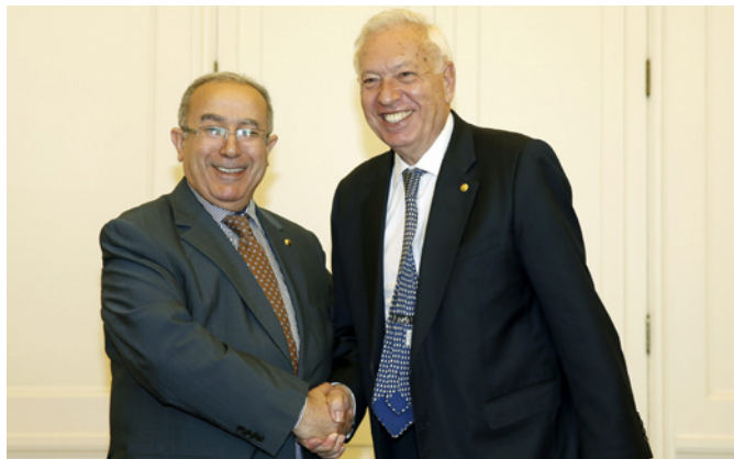
El ministro de Asuntos Exteriores y de Cooperación, José Manuel García-Margallo, junto a su homólogo argelino durante un encuentro celebrado en Barcelona en abril de 2015.

países que trabaja activamente con el fin de reunir las condiciones adecuadas para la celebración de la próxima cumbre de la Unión.