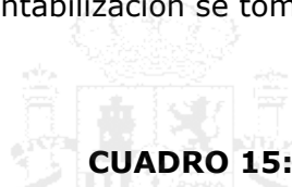
CUADRO 15: FLUJO DE INVERSIONES DE ESPAÑA EN EL PAÍS

discrepancia. Por un lado, el tipo de cambio pues depende del momento de la contabilización se tomará un valor diferente de tipo de cambio.